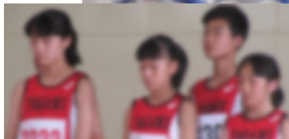
中越地区大会激励会